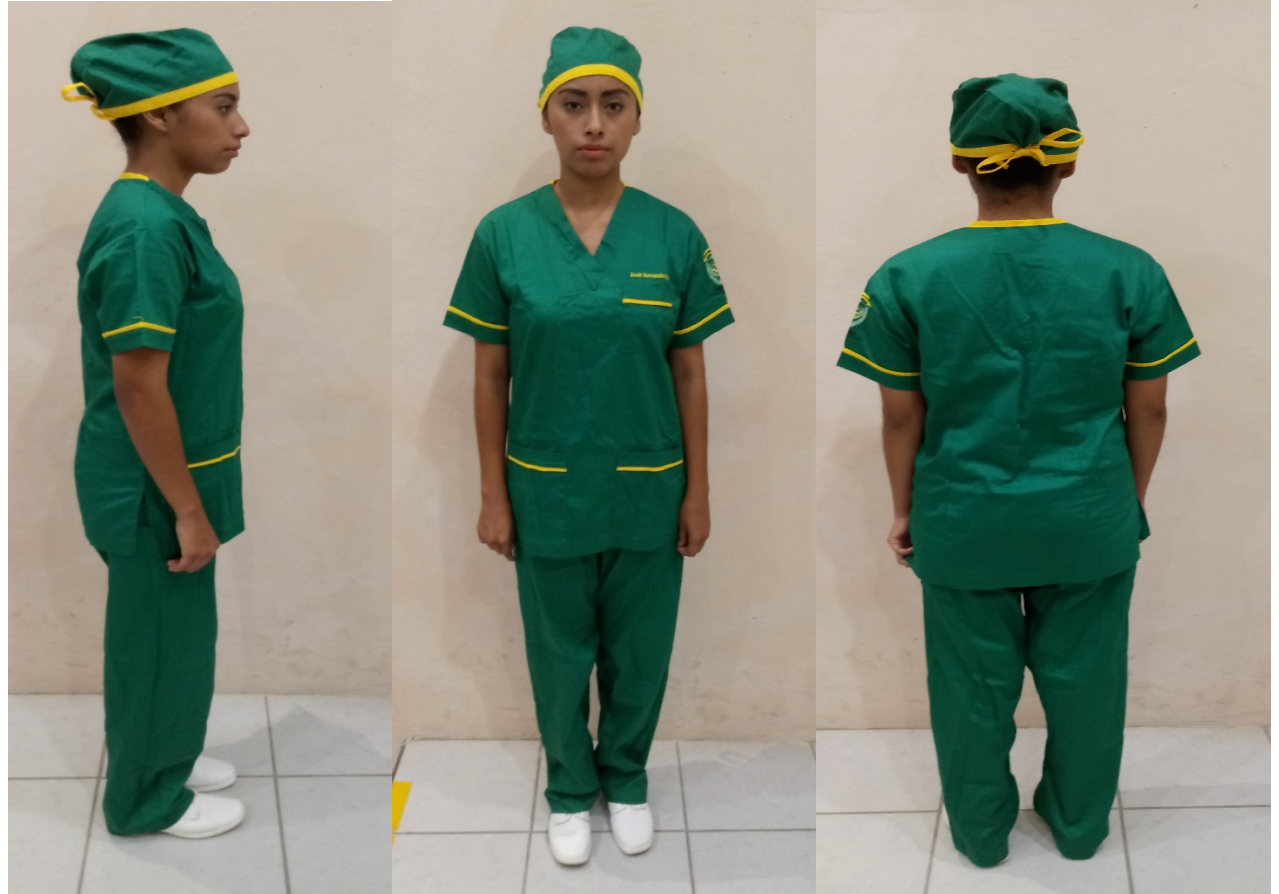
UNIFORME DE SEGUNDO SEMESTRE