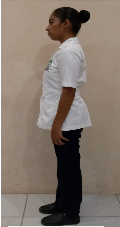
UNIFORME DE MARTES A VIERNES PRIMER SEMESTRE