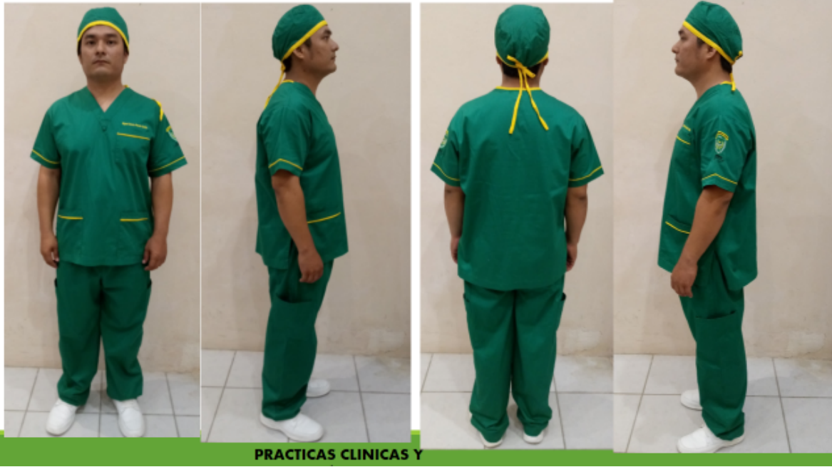
PRACTICAS CLINICAS Y