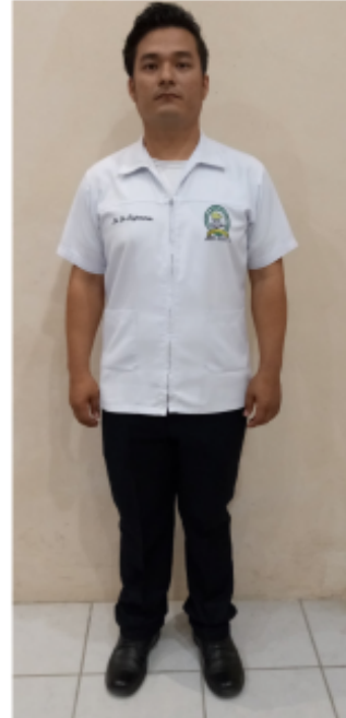
MARTES A VIERNES